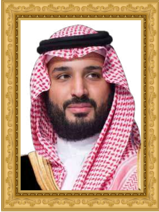
الامير محمد بن سلمان بن عبدالعزيز آل سعود