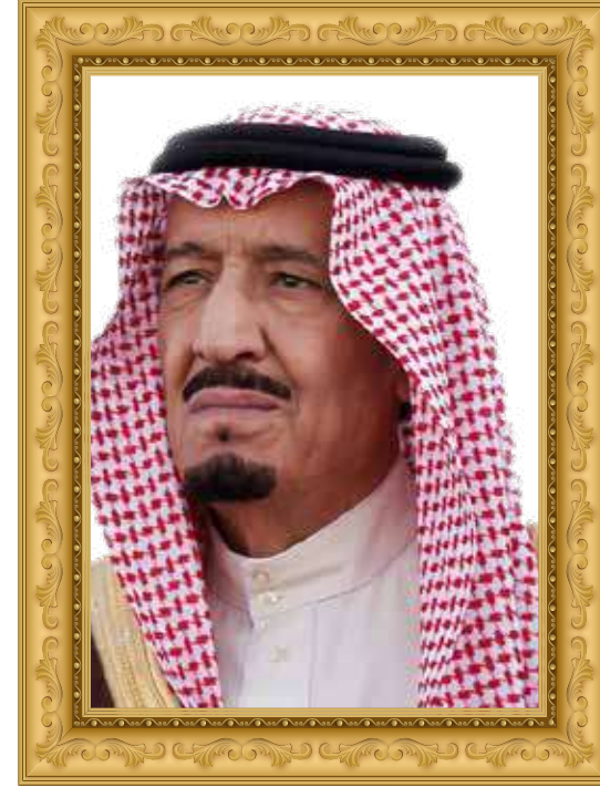
الملك سلمان بن عبدالعزيز آل سعود